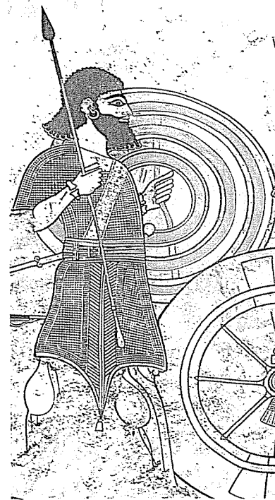
Doc. 7 Soldado asirio armado.

Los carros de guerra fueron usados primero como fuerza de choque y luego en la lucha abierta. Eran tirados por dos o cuatro caballos, y cargaban hasta tres ocupantes: un conductor, un guerrero con lanza y arco y un servidor que con un escudo protegía los cuerpos de sus dos compañeros. Cuando sitiaban una ciudad, los asirios utilizaban arietes y máquinas móviles como torres de asalto. Además, abrían boquetes en las murallas separando las piedras con barretas.