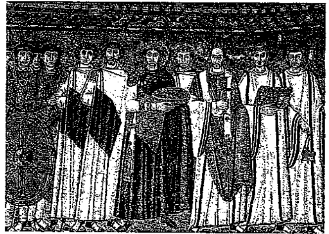
El emperador Justiniano con su séquito.

Si bien el Imperio tuvo un renacimiento, entre los siglos IX al XI, caerían nuevamente ante el avance de los turcos seldyúcidas, que se apoderaron de parte de Asia Menor y de Palestina. Estos acontecimientos marcaron el inicio de la decadencia del Imperio, que llegaría a su fin en el año 1453, cuando Constantinopla fue tomada por los turcos otomanos.