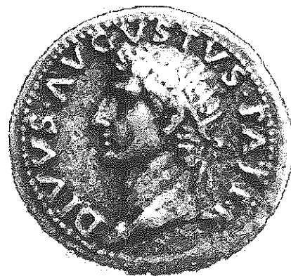
Moneda acuñada por Tiberio con la efigie de Augusto.

La dinastía Flavia fue buena administradora, contribuyendo a integrar las distintas regiones del imperio romano, y haciendo construir monumentos y obras públicas. La siguiente dinastía, de los Antoninos , hizo resurgir el espíritu de Augusto, dando esplendor a la época. Sin embargo, ésta fue opacada por el último de sus sucesores, Cómodo , que hizo un pésimo gobierno, cruel y derrochador. En esa época, los germanos (tribus "bárbaras" para los romanos) se habían desplazado en el territorio europeo ocupando la zona oriental del río Rin, y ejercían presión sobre las fronteras romanas. Según los romanos, Cómodo fue perezoso, ya que en lugar de luchar contra los bárbaros, negoció con ellos comprándoles una paz considerada vergonzosa por sus compatriotas. Murió asesinado en el 192 d.C., y lo siguió una época de anarquía militar.