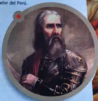
Pizarro, conquistador del Perú.