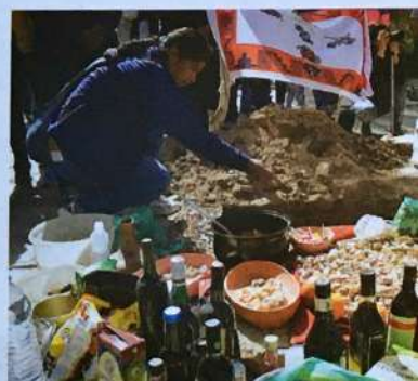
▲ Celebración de la Pachamama en Cachi, Salta, en agosto de 2017. Esta festividad se realiza cerca del fin del invierno, antes de la roturación de las tierras de cultivo.